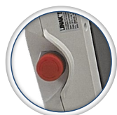
Botón de parada de emergencia