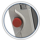
Botón de parada de emergencia